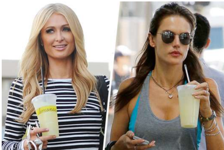
Paris Hilton; Alessandra Ambrosio.

מי לימון הופכים להיות השתיה שלכם משך כל היום. פשוט לא שותים שום דבר אחר, אלא רק את מי הלימון. מומלץ להחליף גם את ספל הקפה או התה שלכם בכוס מי לימון. (מי שאינו יכול... שישתה כוס קפה אחת בבוקר) כיון שמומלץ לשתות בין 8-12 כוסות מים ליום, זו גם כמות מי הלימון שיש לשתות בתוכנית הזו. כוס בבוקר כשקמים, כוס בלילה לפני השינה, כוס לפני כל ארוחה, כוס אחרי כל ארוחה... זו התוכנית.